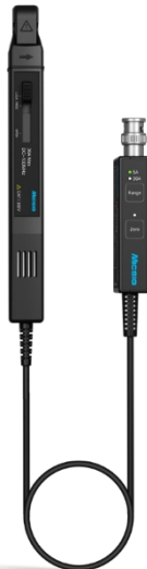
CP503B / CP1003B