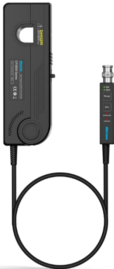
CP3008 / CP3005 / CP1510

Mit 5-mm- und 20-mm-Klemmenoptionen, Ein-Knopf-Entmagnetisierung/Auto-Zero und einem integrierten Überstromalarm gewährleistet die CP-Serie eine einfache Bedienung und Sicherheit. Die standardmäßige BNC-Schnittstelle ist mit den meisten Oszilloskopmarken kompatibel und eignet sich daher ideal für Tests im Bereich der neuen Energien und der Industrieelektronik.